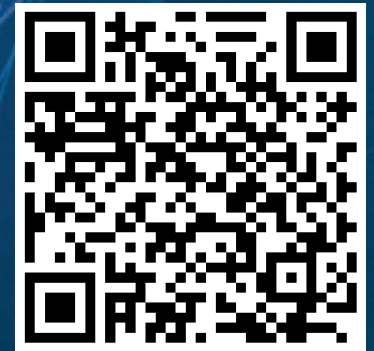
T06470 Titan 65 EL EN1 Fire