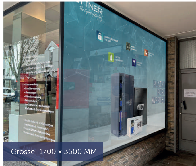
Grösse: 1700 x 3500 MM