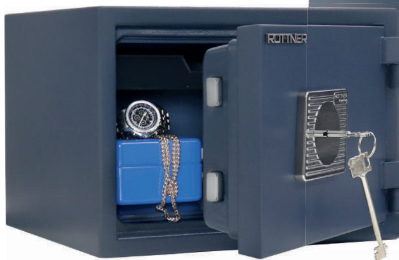
T06471 Titan 30 S2 Fire