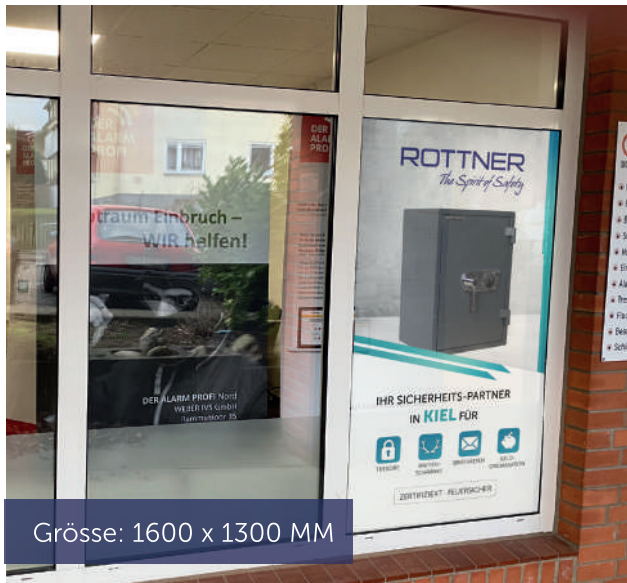
Grösse: 1600 x 1300 MM