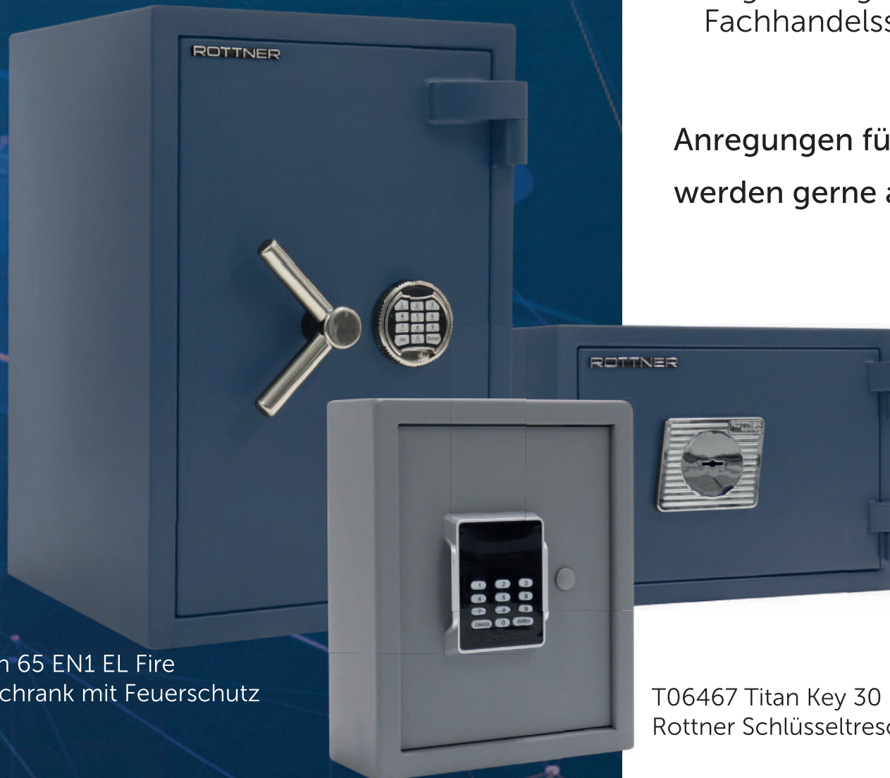
T06470 Titan 65 EN1 EL Fire Wertschutzschrank mit Feuerschutz

Anregungen für Sortimentserweiterungen werden gerne angenommen