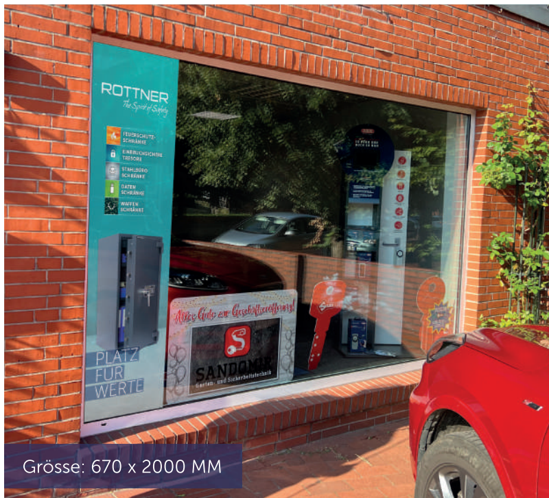
Grösse: 670 x 2000 MM